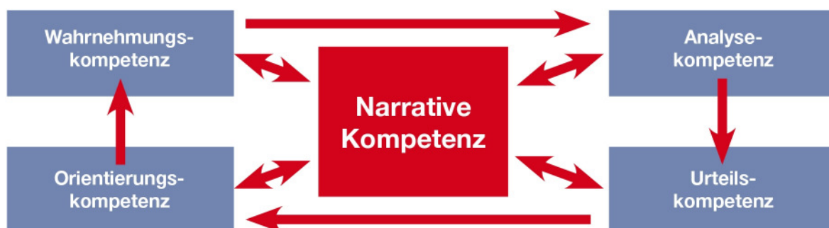
Abb. 3: Kompetenzbereiche des Faches Geschichte

Die „Orientierungskompetenz für Zeiterfahrung“ beschreibt die Fähigkeit, in der Beschäftigung mit Geschichte einen Sinn für das eigene Weltverständnis zu sehen. Sie beruht auf dem Zusammenhang zwischen Gegenwärtigem und Vergangenen und verhilft dazu, den Einfluss historischer Zusammenhänge auf die Gegenwart, auf aktuelle Ereignisse und Entwicklungen zu erklären. Sie befähigt zur Einordnung von Faktenbeständen sowohl in einen thematischen bzw. sachlich-analytischen als auch in einen chronologischen Zusammenhang. Geschichte kann als notwendiges Instrument erkannt werden, um die historische Bedingtheit gegenwärtiger Sachverhalte und Phänomene zu verstehen und die eigene Lebenswirklichkeit zu erklären. Sie ermöglicht es, das eigene Tun und Lassen plausibler zu begründen. Außerdem verhilft sie dazu, in aktuellen Diskussionen die eigenen Einstellungen, Vorurteile, Haltungen, Deutungsmuster und Wertmaßstäbe in den Geschichtsunterricht einzubringen, diese zu reflektieren und kritisch zu hinterfragen. Aus der Kenntnis von Zwängen und Freiheiten, denen historische Entscheidungen unterlagen, können Handlungsspielräume für die Bewältigung der Gegenwart und die Gestaltung der Zukunft benannt werden. Somit verhilft die Orientierungskompetenz letztlich zu ethisch verantwortlichem Handeln. Diese Kompetenz führt zu eigenen Werturteilen.