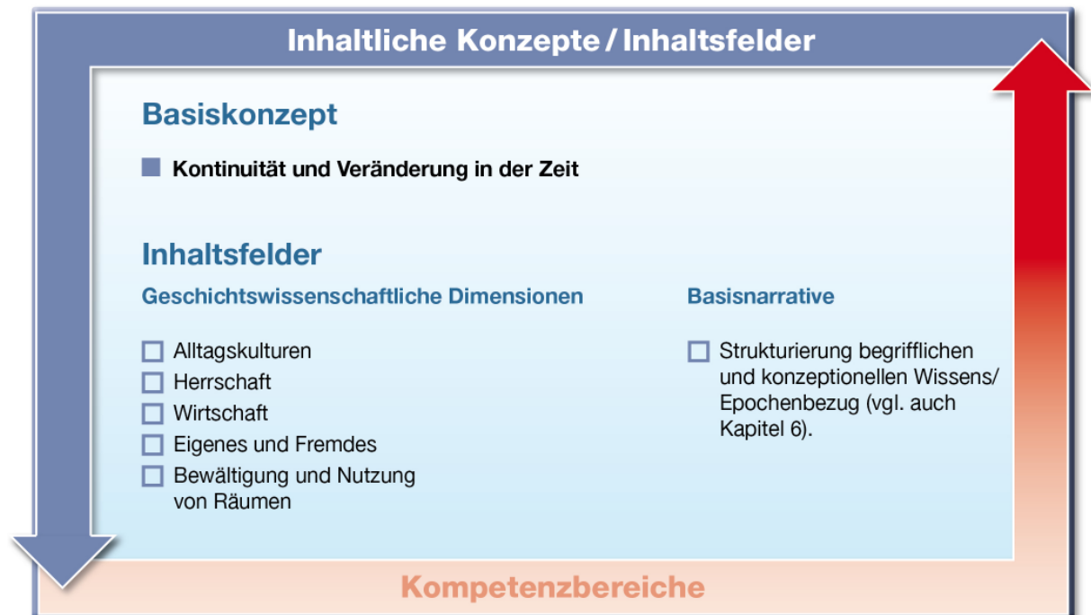
Abb. 4: Basiskonzept und Inhaltsfelder

Das Basiskonzept und die Inhaltsfelder helfen den Lernenden dabei, sich im Universum der Geschichte zurechtzufinden, damit sie die historischen Kompetenzen ausbilden können. Außerdem können diese Zugriffsweisen bei der Erstellung von Schulcurricula und der Generierung von Unterrichtsthemen dienen.