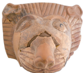
Abb. 1: Abb. 2, 4 Abb. 3