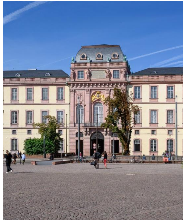
TU Darmstadt//Patrick Bal 1

Technische Universität Darmstadt Institut für Geschichte Residenzschloss 1 (S3|12) Poststelle (S3|13) 64283 Darmstadt Deutschland