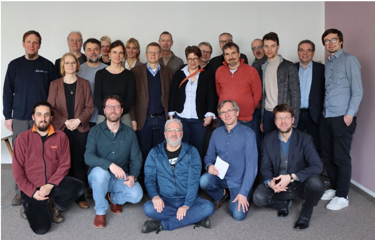
Abb. 1. Kick-off-Treffen der Teilprojektleiterinnen und -leiter des DFG-Schwerpunktprogramms 2361 „Auf dem Weg zur Fluvialen Anthroposphäre“ im Leipzig Lab der Universität Leipzig am 9. und 10. März 2023 (© Arbeitsgruppe Physische Geographie, Universität Leipzig).

Das DFG-Schwerpunktprogramm 2361 „Auf dem Weg zur Fluvialen Anthroposphäre“ überprüft die Schlüsselhypothese der vormodernen Genese einer Fluvialen Anthroposphäre. Alle Teilprojekte des Schwerpunktprogramms untersuchen mittelalterliche und vorindustrielle Auen und Flussgesellschaften in den Flusssystemen des Rheins, der Elbe sowie der Donau und fragen, wann und warum Menschen zum signifikanten Steuerungsfaktor der Auenentwicklung wurden. Das Schwerpunktprogramm verfolgt einen strikt multidisziplinären Ansatz unter Einbindung von Archäologie, Geschichte und Geowissenschaften.