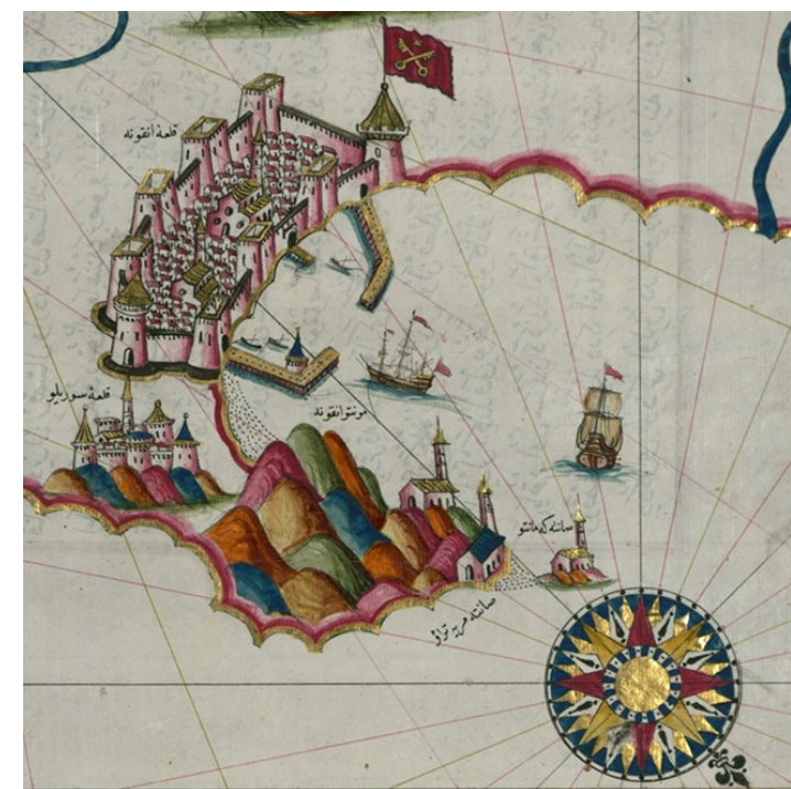
Der Hafen von Ancona im Kitab-i Bahriye Kitab-i Bahriye, Baltimore, Walters Art Gallery, MS. W. 658, fol. 192a.

Technische Universität Darmstadt Institut für Geschichte Mittelalterliche Geschichte Residenzschloss 1 64283 Darmstadt baumgaertner@pg.tu-darmstadt.de